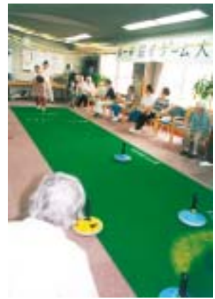
これがユニカールです。